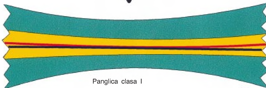
Panglica clasa I