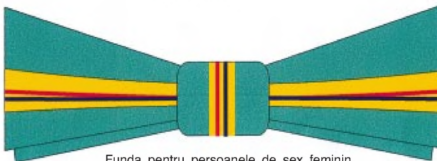
Funda pentru persoanele de sex feminin