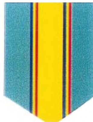
Rozeta clasa a III-a