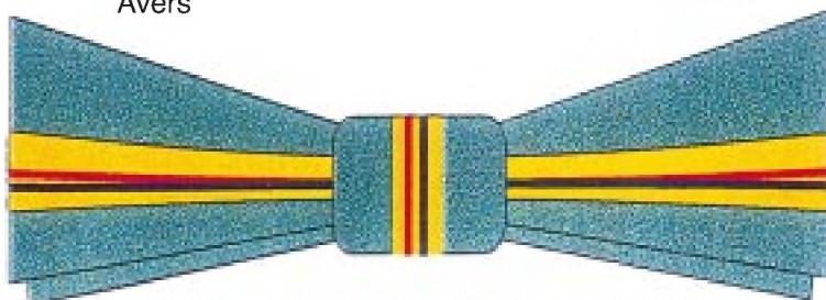
Funda pentru persoanele de sex feminin